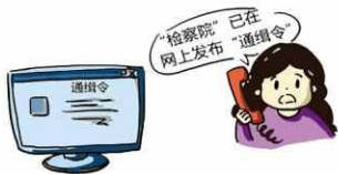
“打开xxx网站，若想洗清嫌疑”

编造你涉嫌银行卡洗钱、拐卖儿童犯罪等理由，同步发送伪造的公检法官网、通缉令、财产冻结书等，对你进行威逼、恐吓，以使你相信和就范。